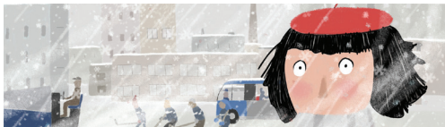
A Menina de Boina Vermelha

Palavras-chave: família, amor, cozinhar, super-heróis, natureza, cidade, música.