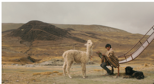
Entre Rochas e Nuvens