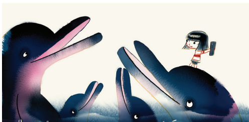
A Menina com os Olhos Ocupados