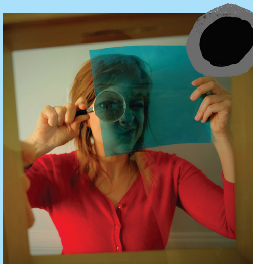
Baileia | Oficina "Agora não: OCUPADA!"