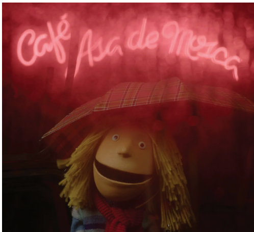
Os Amigos do Gaspar: Uma Reunião na Cidade

Neste maio de abril, ou quando ainda vivemos abril em maio, o IndieJúnior convida-vos a ver o mundo projetado no grande ecrã.